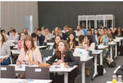
Participantes del Congreso Latinoamericano en Medellín