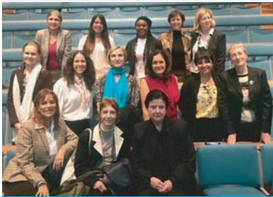
Científicas en LAC Days 2019