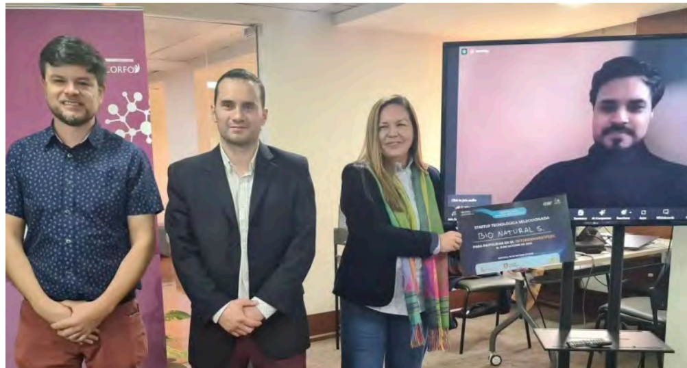
Gewinner des Investor Pitchkurs, Bio Natural Solutions aus Peru und Quelp aus Chile.

Weitere Informationen hier pvaldivia@bayern-chile.cl