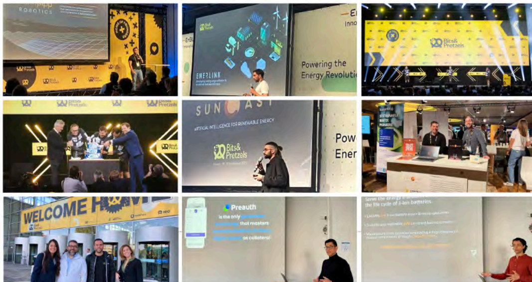
Die lateinamerikanischen Scaleups in Bayern

Weitere Informationen hier www.baylat.org