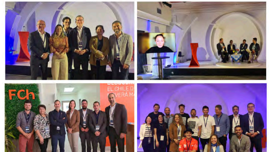
Die Partner, Scaleups, VC und Fund of Funds des OktoberINVESTfest 2023

Weitere Informationen hier www.oktoberinvestfest.com/home-latam