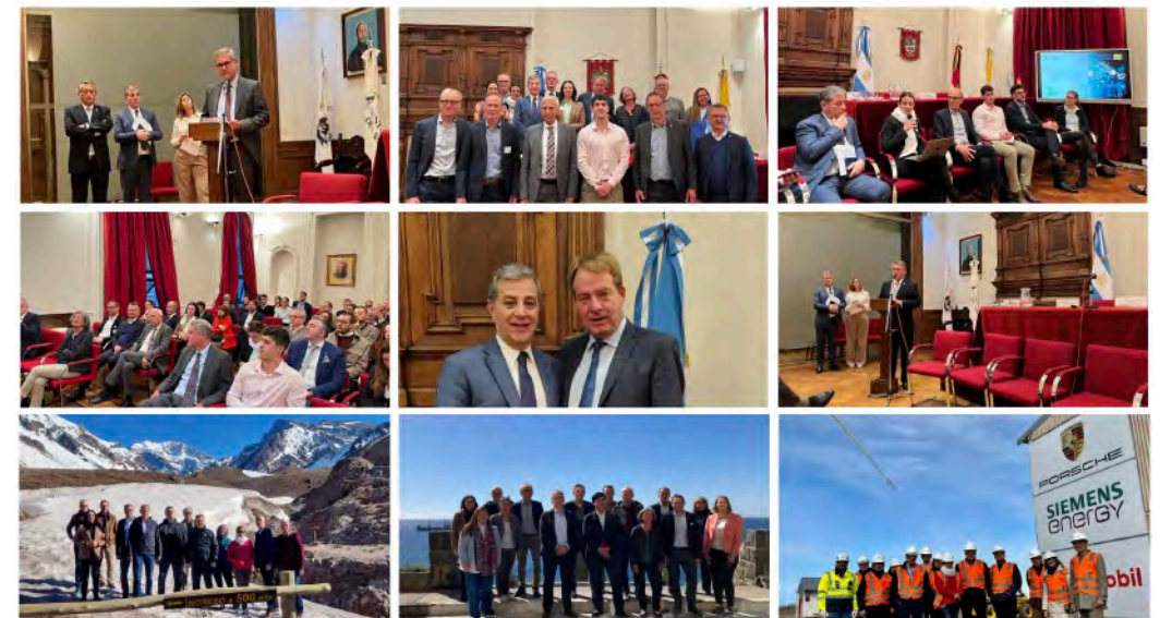
BAYLAT in Argentinien & Chile